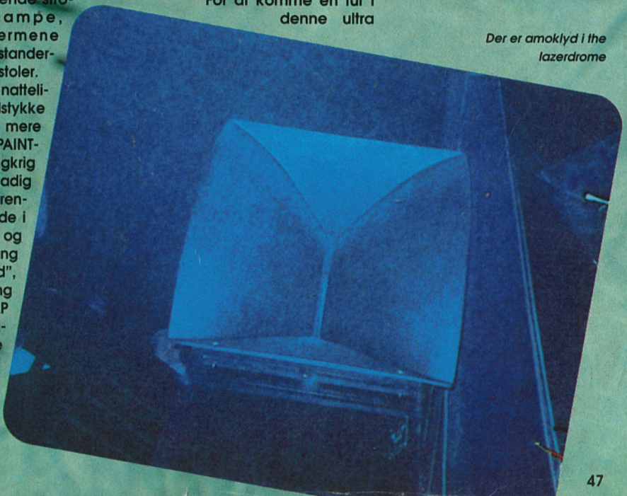
Der er amoklyd i the lazerdrome

urealistiske hammerverden skal du først en tur til England og derefter nærmere betegnet til Peckham i London, hvor THE LAZERDROME holder åbent hver lørdag fra 8 aften til 3 om natten. Yderligere info om et af verdens mest spacede diskoteker kan fås ved at ringe direkte til England på tlf. 009+44+815778901. Dette sted SKAL du opleve hvis du skal til London. DET BLIVER DET VILDESTE DU NOGENSINDE HAR OPLEVET!!!