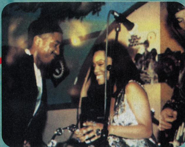
Brand New Heavies

Vild april. I denne måned bliver du trukket gennem dødsdromet - Londons nyeste diskotekspåhit. Hvis du kommer levende ud, kan du læse om THE HYPNOTEST, en af verdens bedste houseproducere, du kan checke Dennis i TØJBLITZ eller finde ud af, hvad der sker med HIP HOPPEN lige nu. Læs videre og føl pulsen pumpe!!